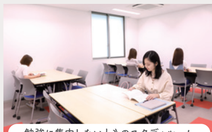
勉強に集中したいときのスタディールーム