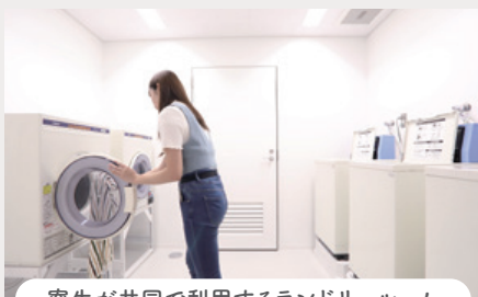
寮生が共同で利用するランドリールーム