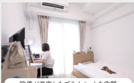
設備が充実したプライベートな空間