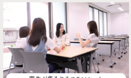
寮生が集まれるコモムルーム