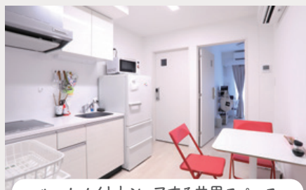
ルームメイトとシェアする共用スペース