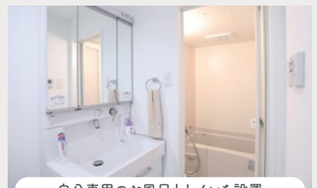
自分専用のお風呂とトイレを設置