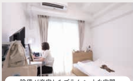
設備が充実したプライベートな空間