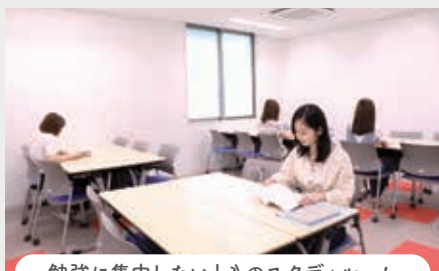
勉強に集中したいときのスタディールーム