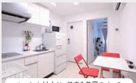
ルームメイトとシェアする共用スペース