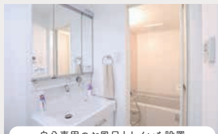
自分専用のお風呂とトイレを設置