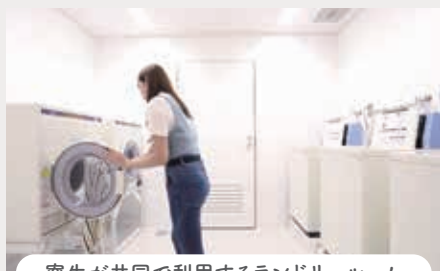
寮生が共同で利用するランドリールーム