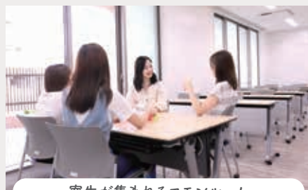
寮生が集まれるコモムルーム